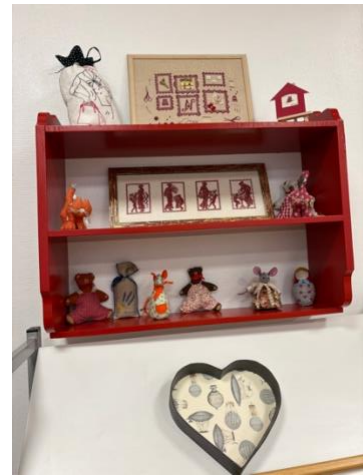
Broderie et Papotages : 12 inscrits

« Une galerie de photos vaut mieux qu'un long laïus » :